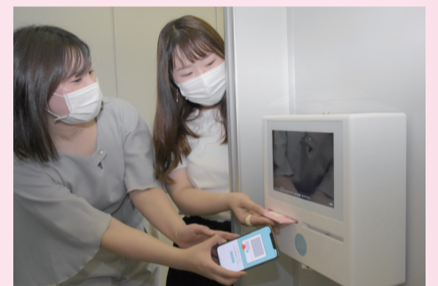
OiTr(オイテル)を試してみました